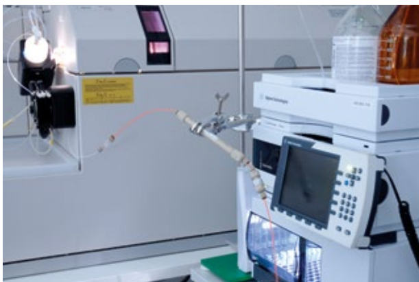
Kopplung der LC mit der ICP-MS zur Element-Spezies-Bestimmung

Sowohl die essentiellen als auch die toxischen Eigenschaften der Elemente hängen meistens von ihrer chemischen Bindungsform ab bzw. in welcher Spezies diese Elemente vorliegen. So haben z.B. sechswertige Chromverbindungen eine deutlich höhere Toxizität als die dreiwertigen Chrom-Spezies. Im Falle des Arsens sind die anorganischen Spezies eindeutig kanzerogen und stark toxisch verglichen mit dem viel weniger toxischen Arsenobetain. Gerade diese organisch gebundene Spezies kann jedoch nach Fischverzehr den Gesamt-Arsen-Gehalt im Urin signifikant erhöhen somit eine Intoxikation mit Arsen vortäuschen. In so einem Fall ist zur klinischen Diagnostik daher die quantitative Differenzierung der einzelnen Arsen-Spezies im Urin notwendig.